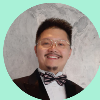
陸堅智 高男高音 著名電台音樂節目主持